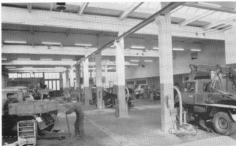
Teilansicht der Werkhalle

Hierfür sind sieben Fachvertreter eingesetzt.