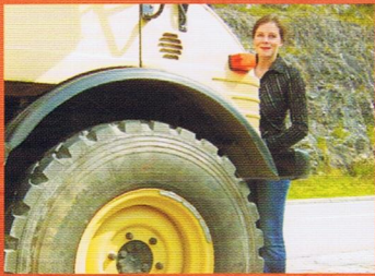
Die Frau als solche & der Unimog Seite 14