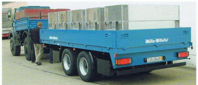
Spezialanhänger mit Fischcontainer von Müller-Mittelalt für einen Fischhändler in Tirschenreuth. ▲ (1)