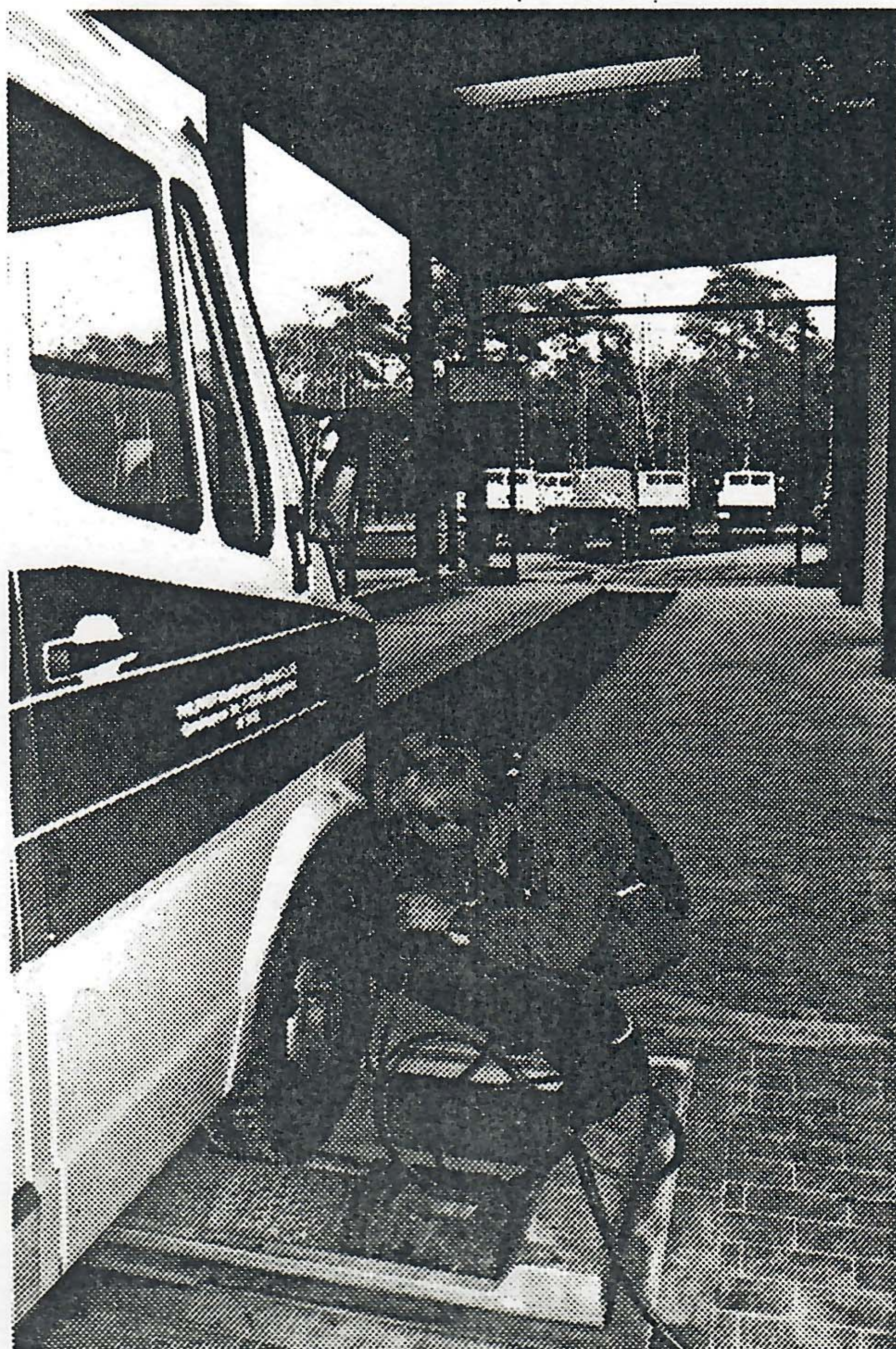
Der Bremsprüfstand der Firma Endres in Ludwigsfelde.

In den nächsten drei bis fünf Jahren will die Firma Endres weitere vier Millionen DM in ihren Ludwigsfelder Betrieb investieren. Ab kommenden Jahr ist der Umbau der zwei Hauptge-