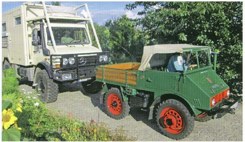
Unimog U 2010 und Unimog U 1550 L mit Safariaufbau.

Aufgabenstellung bei diesem Kunden ist der Abtransport von Klärschlamm. Zentrale Herausforderung: Das Fahrzeug, das den Schlamm auf weichem Untergrund zum Lkw für den Weitertransport bringt, muss die langsam fahrende Fräse begleiten. Die Lösung heißt auch hier: Unimog. Bereits die ersten Unimog Baureihen mit verbreiterten Reifen waren bei den Berliner Wasserbetrieben im Einsatz, in den 90er Jahren löste die neue Baureihe die Vorgänger ab und heute ist der Unimog U 300 in den Klärbecken im Einsatz.