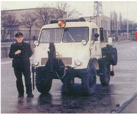
1955 Unimog "Typ 25" mit Westfalia-Fahrerhaus von der BSR.