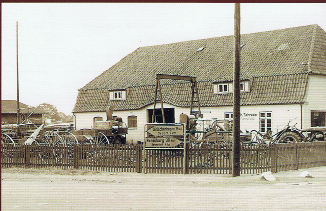
Unimog-Werkstatt Schröder in Schleswig-Holstein