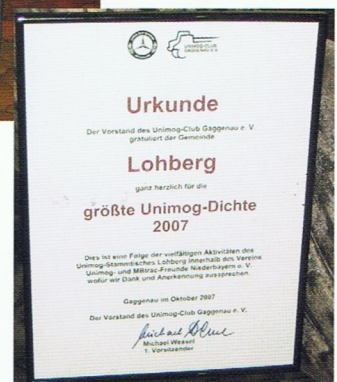
Die Urkunde „Größte Unimog-Dichte 2007“