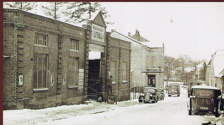
Unimog-Kundendienststation Firma Lythall K.G. in Bad Oldesloe